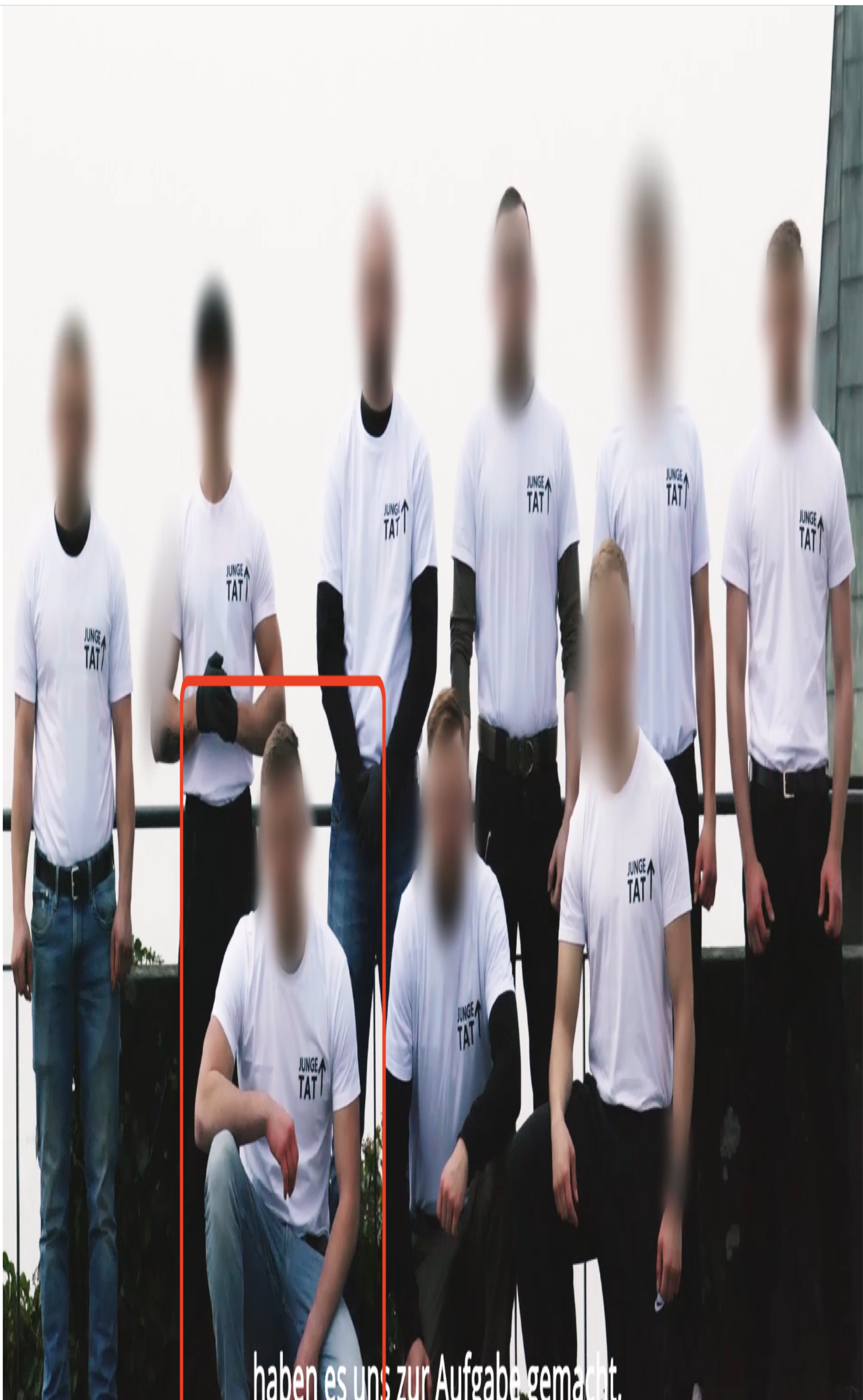
haben es uns zur Aufgabe gemacht.