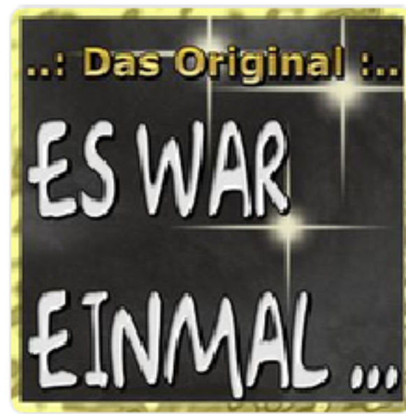
Es war einmal ... Community