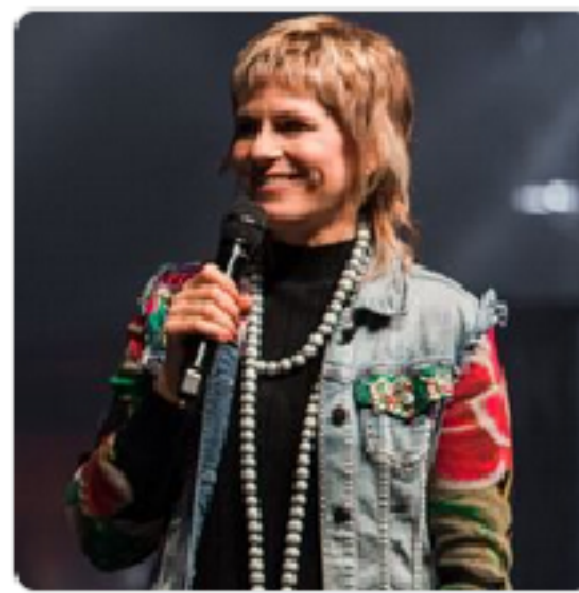
Susanna Bigger Public Figure