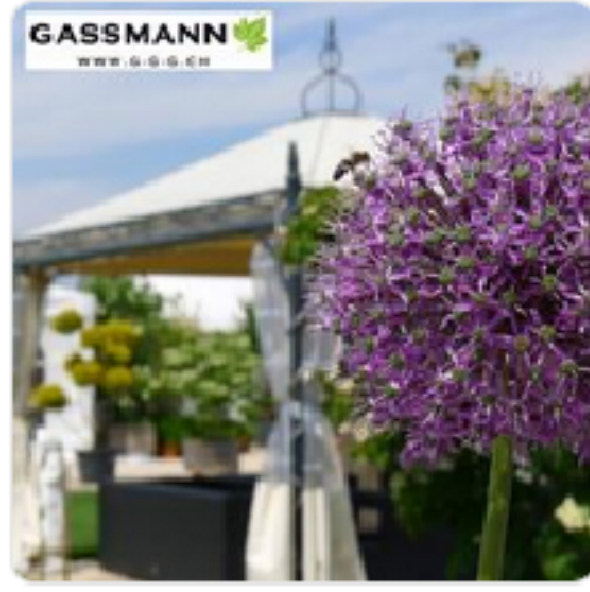
Gassmann Gartenträume / Gassmann Gartengestaltung Gardener