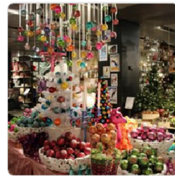
Magazine zum Globus Interest