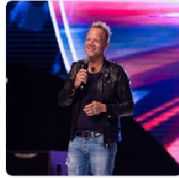
Leo Bigger Public Figure