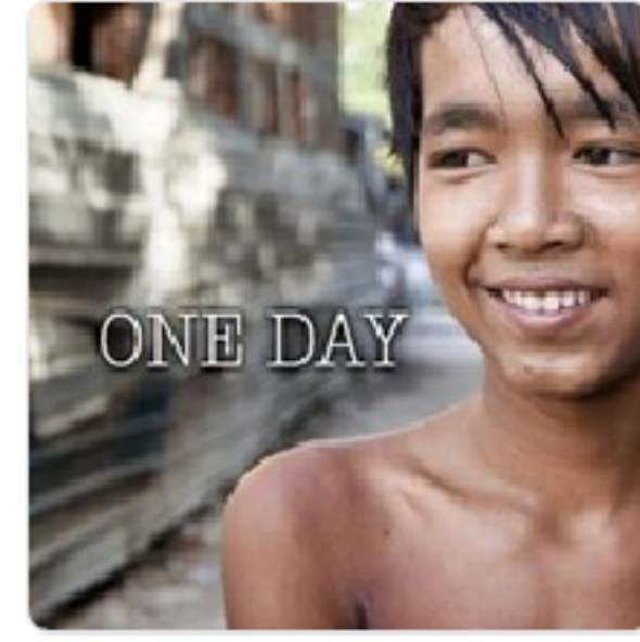
Strupler ART Artist