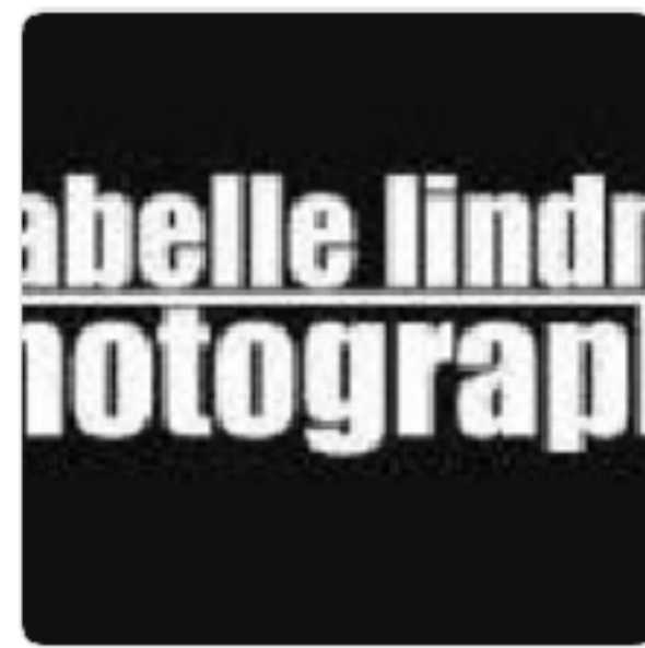
Isabelle Lindner Photography Artist